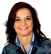
Sara Hernández Alcaldesa

Desde el Ayuntamiento de Getafe, ahora que se inician los diferentes procesos de admisión en escuelas infantiles, casas de niños, colegios y en institutos, editamos un año más esta Guía de Escolarización para el próximo curso escolar, con la intención de que podáis disponer de toda la información necesaria.