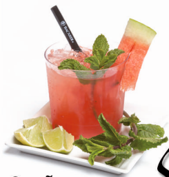
Sueño de verano