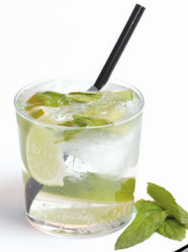
Mojito de melón

Zumo de naranja, ginebra, vodka y triple seco con una gotita de angostura.