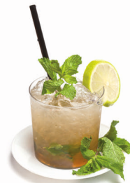
Mojito de Pedro Ximénez