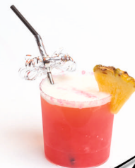
Amanecer en Tokio

Licor de fresa, licor de frutas, ron, azúcar, lima, hierbabuena, y hielo picado.