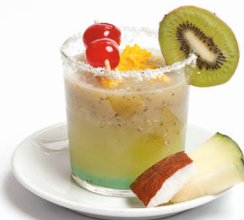
Chandani summer green

Azúcar, zumo de limón hierbabuena, ron, soda y a elegir violeta, vainilla, fresa, mora o maracuyá.