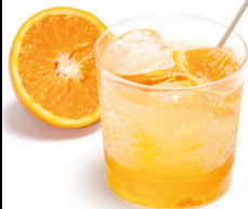
Cóctel de cava

Ron Bacardi, hierbabuena, limas do brasil y sandía.