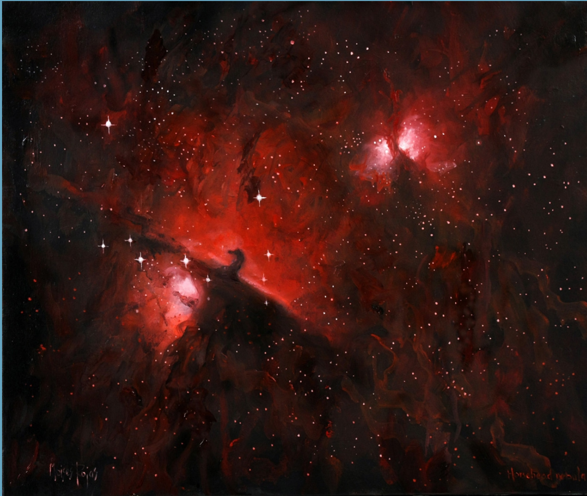
Horsehead Óleo s/lienzo - 55 x 46 cm.