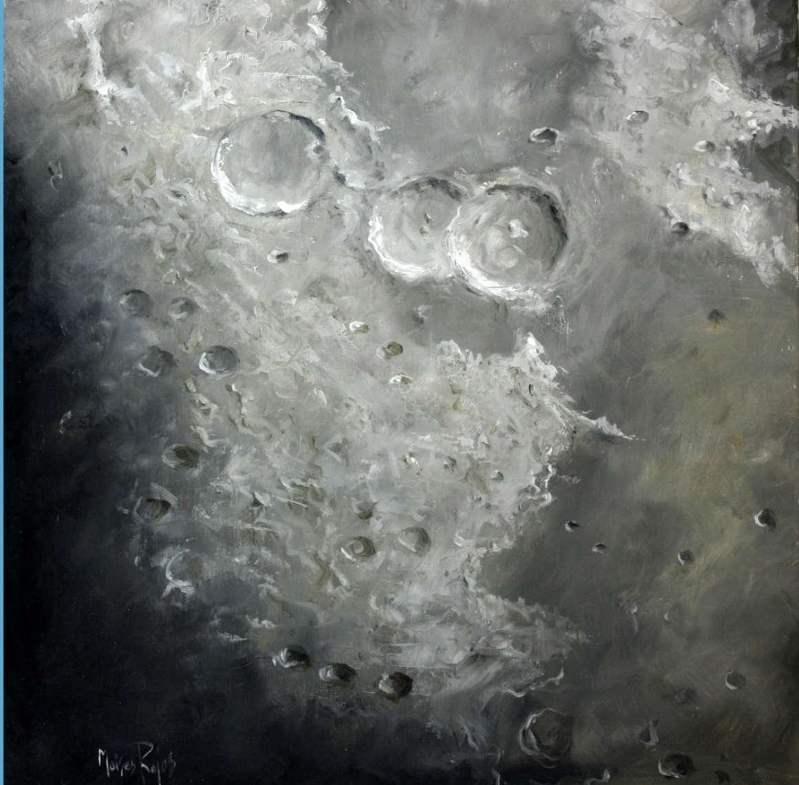
Theophilus, Cyrilus y Catharina Óleo s/tabla - 40 x 40 cm.