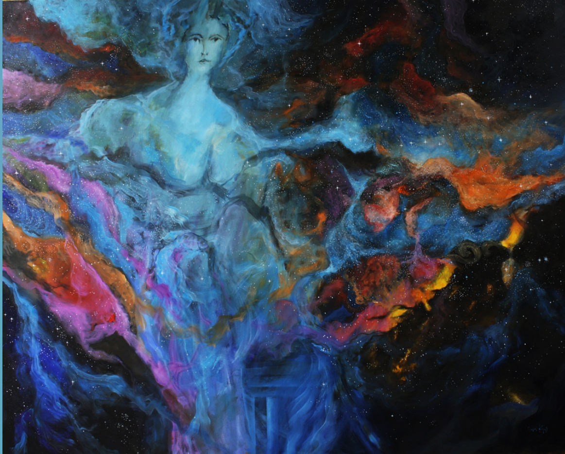
Animalia y Motología Astronómica Óleo s/lienzo - 162 x 130 cm.