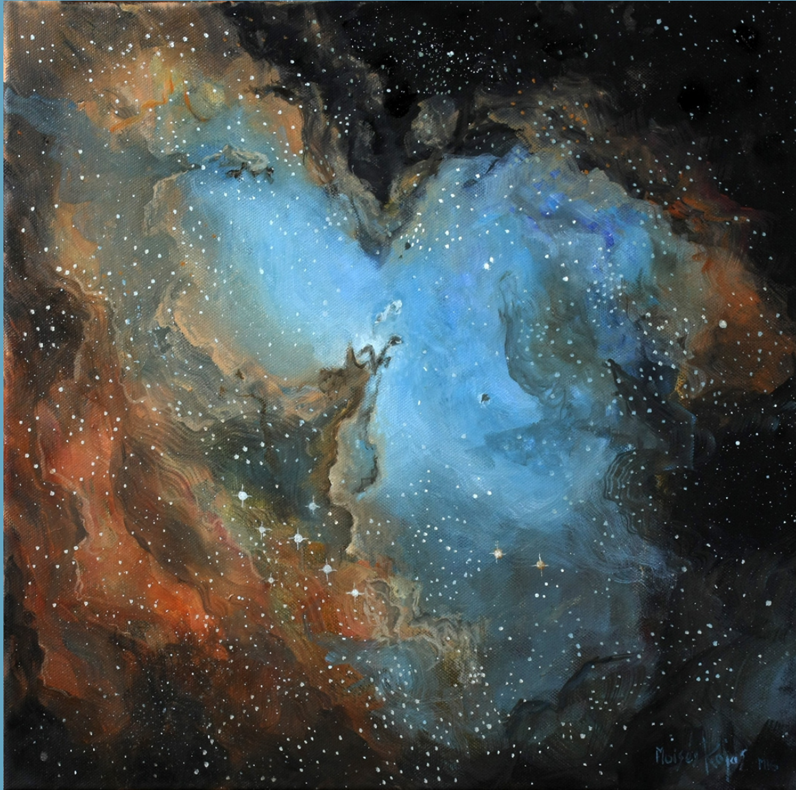
M16 - Nebulosa del Águila Óleo s/lienzo - 40 x 40 cm.