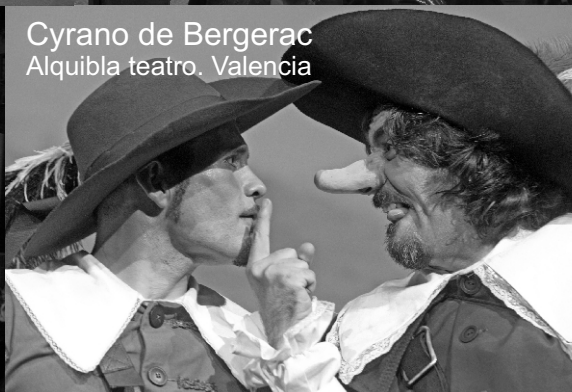
Cyrano de Bergerac Alquibla teatro, Valencia