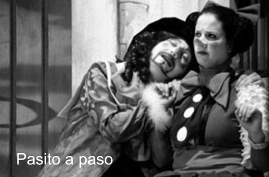
Pasito a paso