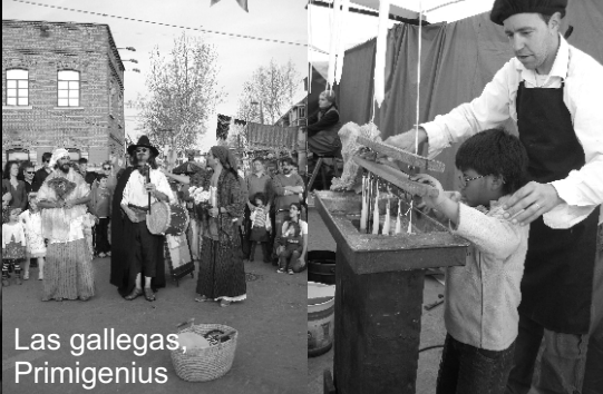
Las gallegas, Primigenius